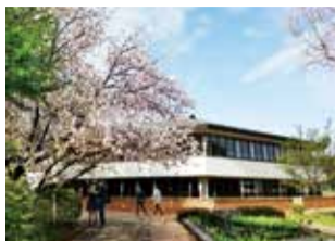
10万平方メートルの緑豊かなキャンパス

学校という若い世代、通学は月に一度のみ「はたらき隊」や、同じものと思いがちだが、んなの目」が必修。講義興味の人たちが集まる多L Aは45歳以上を対象に、の、昼食を囲み、午後種々のグループがあり、交流機会が多いため、学生も少なくない。2016年などを行う。