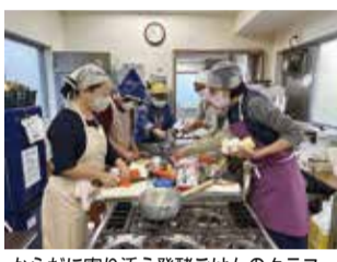
からだに寄り添う発酵ごはんのクラス

自由学園(東久留米市学園町)の45歳以上のための学校「リビングアカデミー」(以下、L A)の9期生募集が、来月15日まで行われている。10万平方メートルの緑豊かなキャンパスで文字通り学園生活を送れる人気のプログラム。選択クラス、自主活動、委員会などがあり、学校を基盤とした生涯学習の場は注目の的だ。 「選択クラス」は自由年度に始まり、現在、約150人が通っている。に選べ、希望すれば何クラスでも選択できる。創作や音楽、料理、自然観察など28クラスがある。カルチャースクールなど決定的に違うのは、学生たちの自主活動が盛んな点。社会に少しでも役立ちたいと活動する